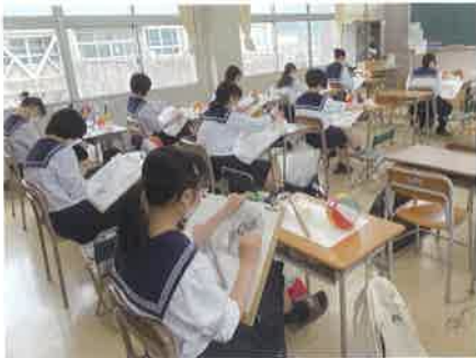
3年生 素描授業風景

名西高校でしかできないことや、仲間の作品を通して新たな表現や技法を学び、成長することができました。中学生の皆さんも、ぜひ名西高校で実り多い高校生活を送ってください。