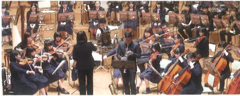
第28回定期演奏会 [令和元年12月21日]